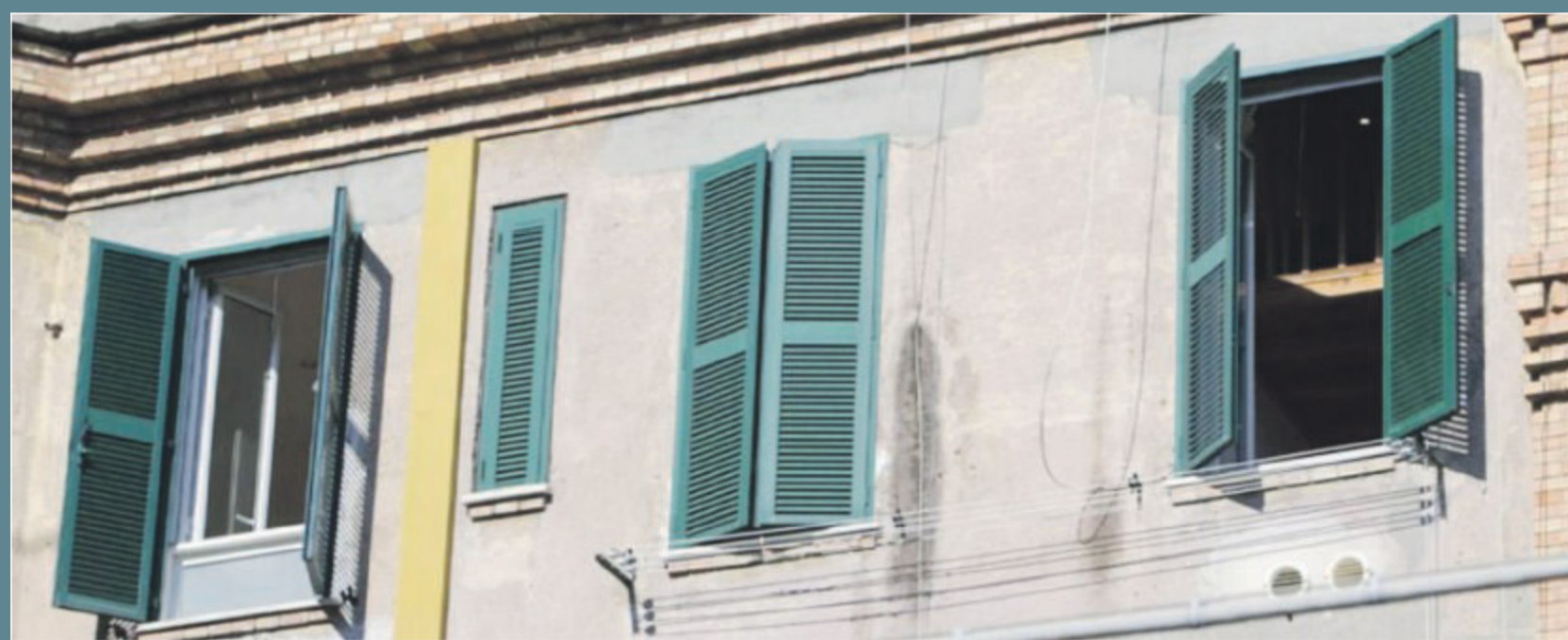
BRANCATI IN II >>

Cirigliano simbolo del fenomeno: il 69% delle abitazioni è senza inquilini